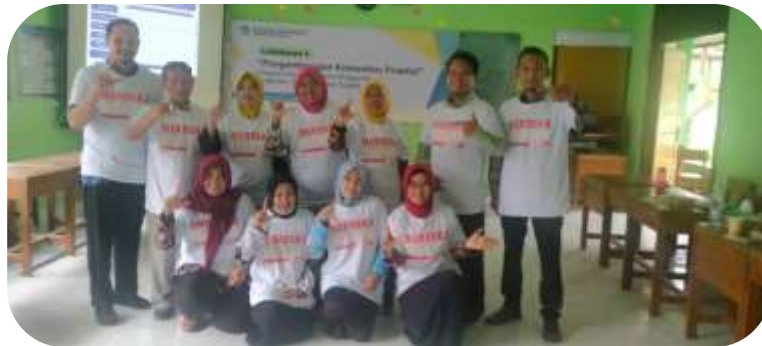
Teman-teman CGP Angkatan 7